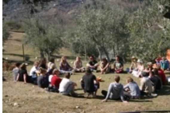
samenkomst in de olijfgaard