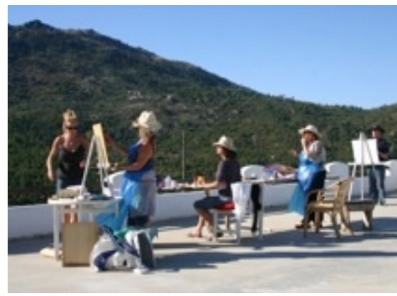
workshop op Panorama terras