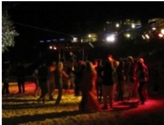
DJ Booth & dance beach