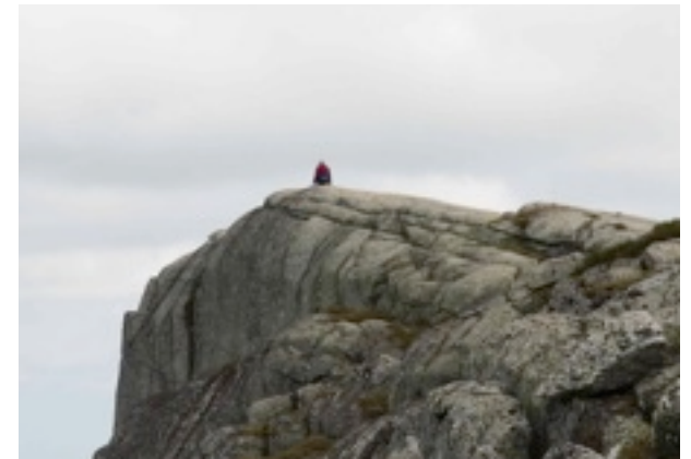
Serra da Estrela