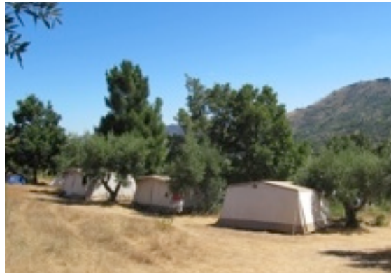
ingerichte tenten in olijfgaard