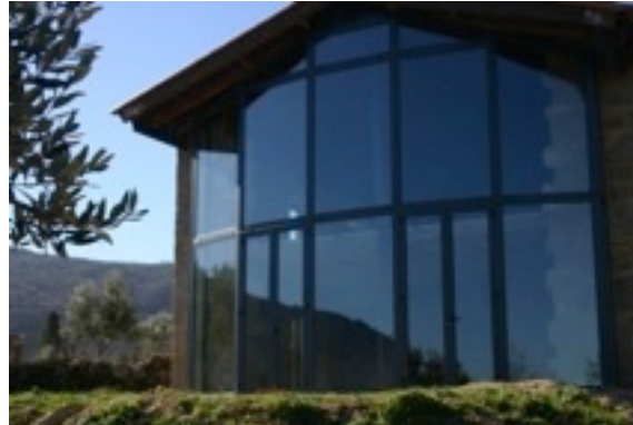
Maluca Art Atelier