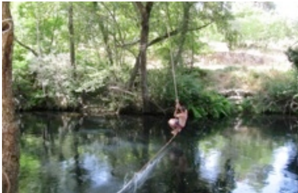
rivier de Mondego